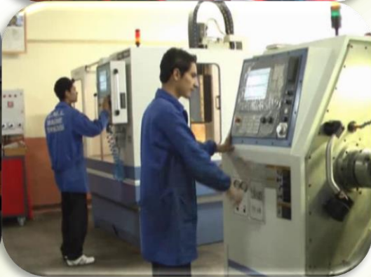
SEYDİŞEHİR MESLEKİ ve TEKNİK ANADOLU LİSESİ