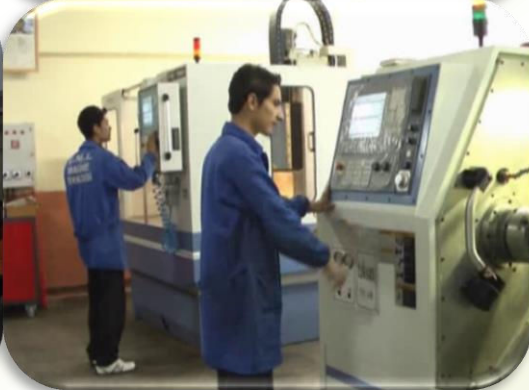
SEYDİŞEHİR MESLEKİ ve TEKNİK ANADOLU LİSESİ