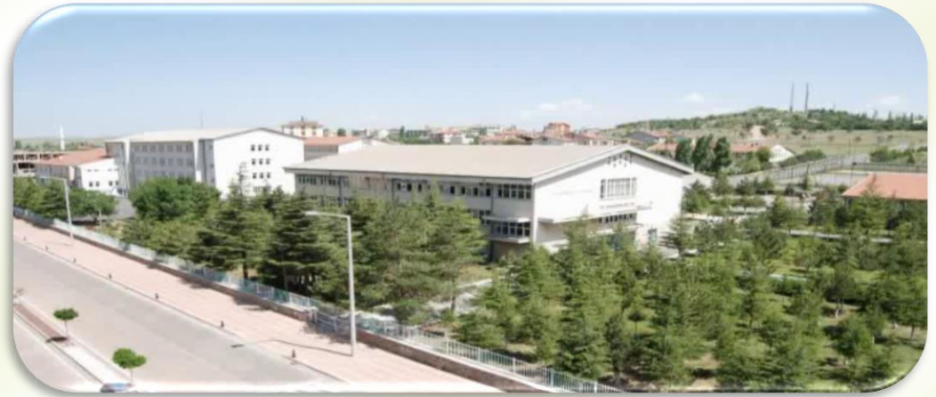
SEYDİŞEHİR MESLEKİ ve TEKNİK ANADOLU LİSESİ