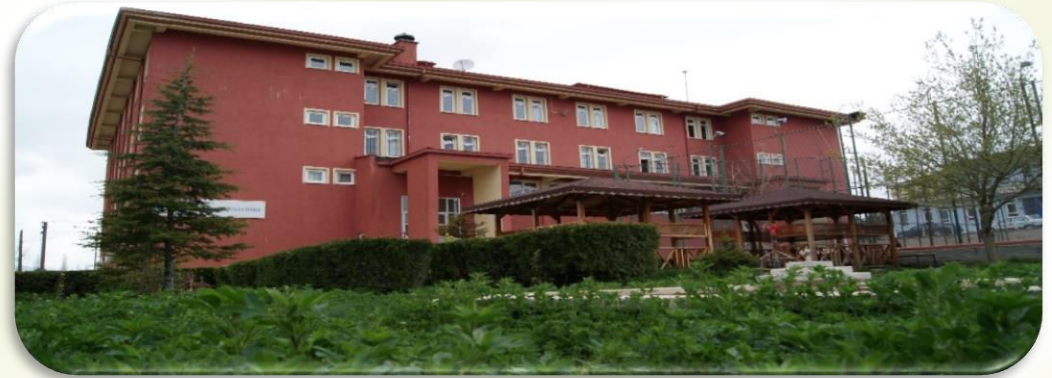
ERKEK ÖĞRENCİ PANSİYONU (100 kişilik)