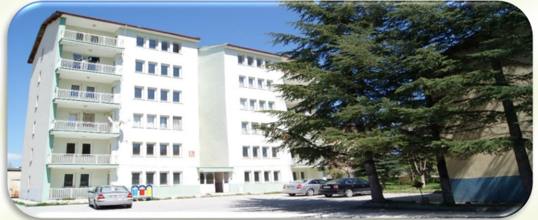
KIZ ÖĞRENCİ PANSİYONU (42 Kişilik)